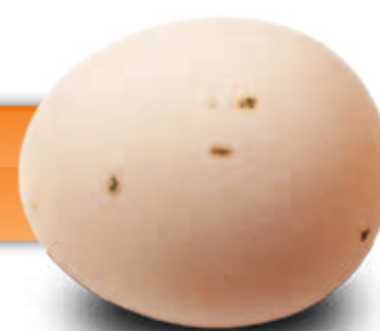
糞が付着した卵 (丁寧に拭き取る 必要がある)